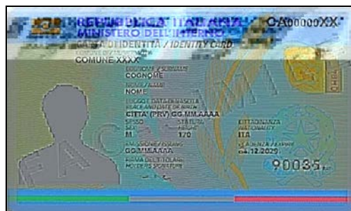
(Carta di Identità)